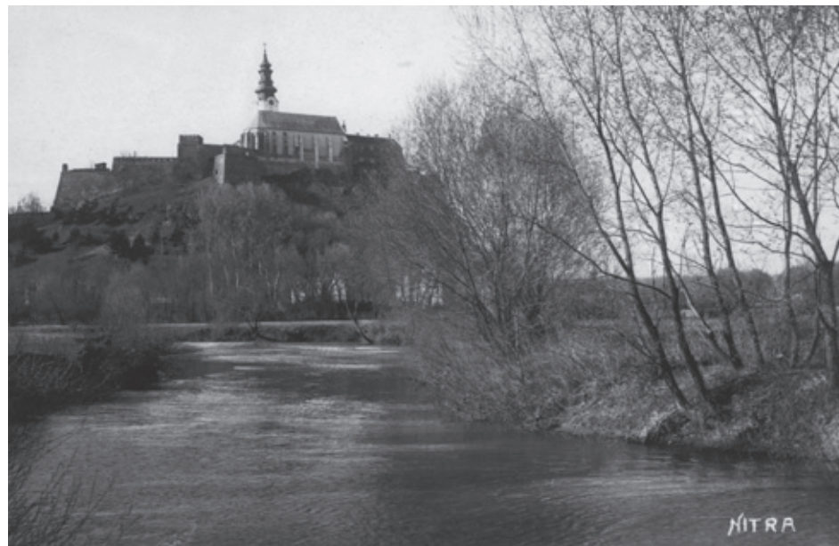
Táto pohľadnica Nitrianskeho hradu pochádza z roku 1930.