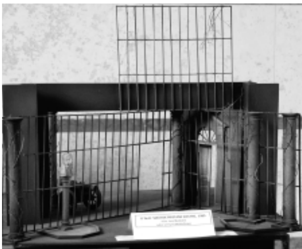
Scéna k inscenácii O' NEILLA - Smútok pristane Elektre.

„Divadelné predstavenie je mnohozložkovým dielom - ako je réžia, scéna, hudba, kostýmy, svetelné efekty, tanec a ďalšie výrazové prostriedky, no však najdôležitejší je práve herec. Každá z týchto zložiek síce pôsobí jednotlivo, ale svojím podielom napomáha spoluvytvárať výsledný efekt. Scéna musí preto spĺňať všetky výtvarné zákony, musí mať svoju poetiku a filozofiu, ktoré sú navzájom neoddeliteľne späté s celkovou režijnou koncepciou,“ hovorí F. Perger a súčasne dodáva: „Scénografia sa rodí v procese tvorby - najskôr vznikajú škice, makety, návrhy a technická dokumentácia, ktoré slúžia ako podklady pre výrobu v tvorivých dielňach. To všetko musí byť