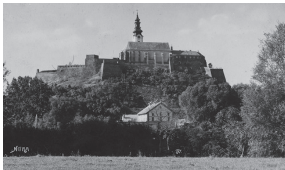
Pohľad na Nitriansky hrad zo začiatku min. storočia, ešte pred reguláciou rieky.